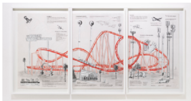
Joan Pallé: The 4th industrial revolution roller coaster, 2022.