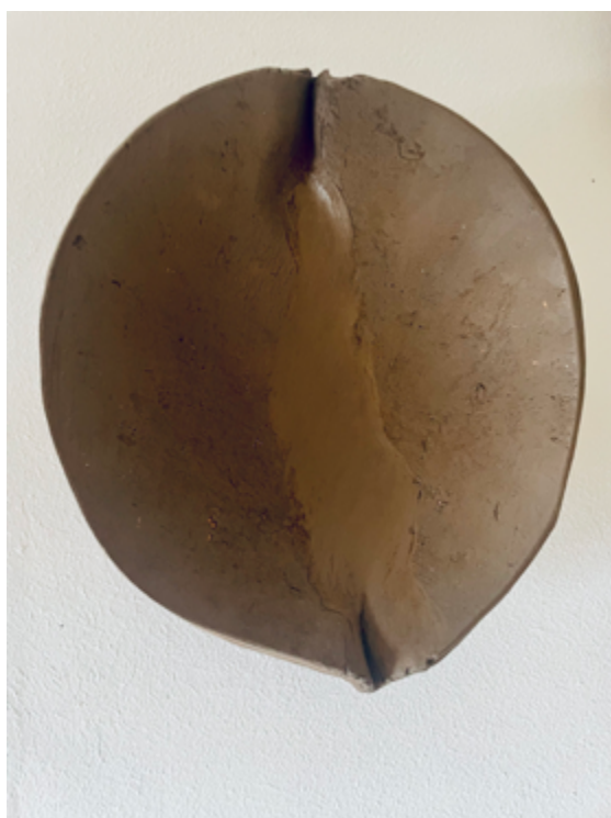
Anna Dot: Libacions, 2025.

Punto de encuentro: 10:30h, esquina entre Centre d'Art Santa Mònica y c/ del Portal de Santa Madrona. Regreso: 14:00h