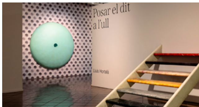
Exposición «Posar el dit a l'ull», de Lluís Hortalà. Espais Volart, Fundació Vila Casas

En Espais Volart de la Fundació Vila Casas: c/Ausiàs Marc 22, Barcelona