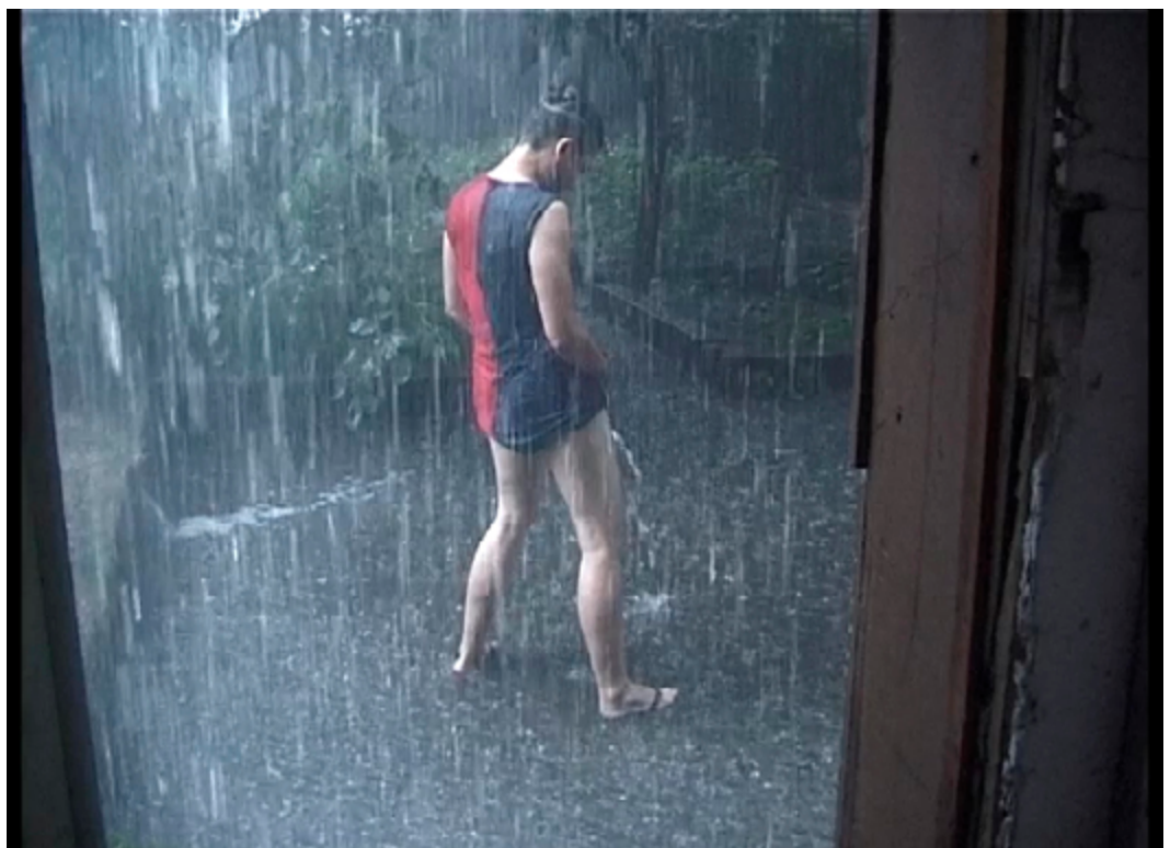
Itziar Okariz: Mear bajo la lluvia, 2019. Cortesía de ethall.

Comentar esta obra de la artista representada por la galería nos permitirá exponer y debatir sobre el papel de los diferentes actores dentro del contexto del arte. ¿Dónde nos ubicamos? ¿Cuáles son nuestras motivaciones? ¿Qué papel queremos jugar? ¿Hasta dónde alcanza nuestro compromiso?