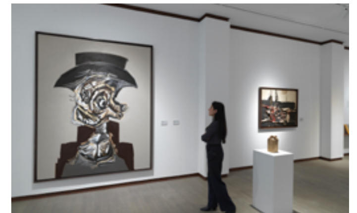
Vista de l'exposició "Saura en el seu context".

Tàssies parlarà sobre els col·leccionistes anònims, així com els orígens d'una col·lecció, les motivacions del col·leccionista i la importància d'un relat.