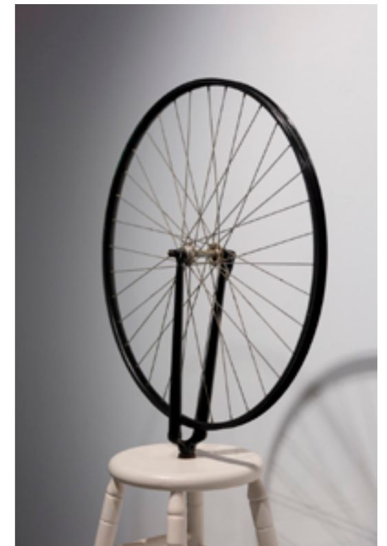
Q. LØSS Collection.