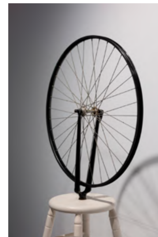
Q. LØSS Collection.