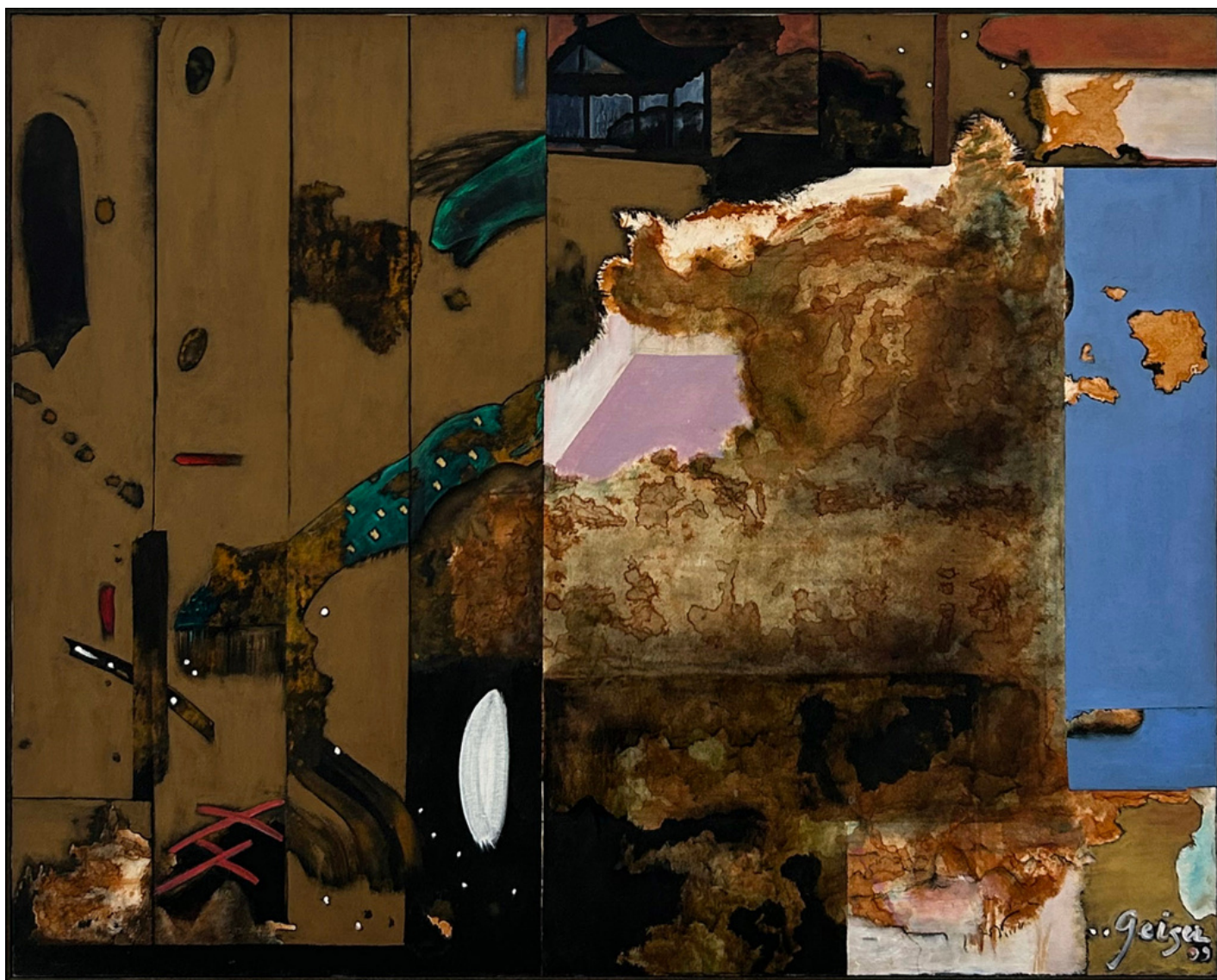
Cave oceano Atlântico com mar Adriático IV 1999. Óleo sobre lienzo 80 x 100 cm

La obra de Anna Bella Geiger ha estado presente desde los años 60 en exposiciones celebradas en museos y centros de arte de todo el mundo, como la Fundación Cartier y el Centre Georges Pompidou, en París; y la Barbican Gallery de Londres. Además, ha participado en la Bienal de Venecia y, hasta en ocho ocasiones, en la Biennial de São Paulo. Su obra forma parte de las más importantes colecciones internacionales de arte, entre las que se pueden nombrar las siguientes: Museum of Modern Art, Nueva York; Centre Georges Pompidou, París; Victoria & Albert Museum, Londres; Museo Nacional Centro de Arte Reina Sofía, Madrid; y Tate, Londres.