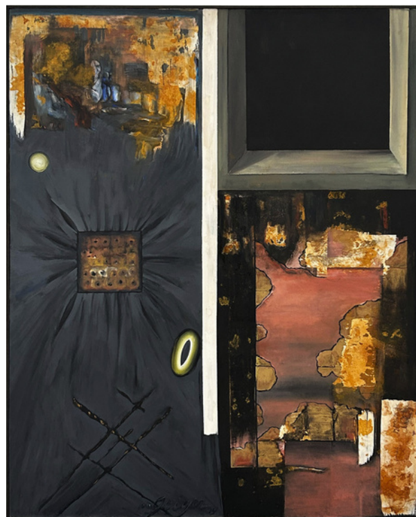
Pier e ocean com favela 1994. Acrílico sobre lienzo 100 x 80 cm

Ya en 1973, empezó a investigar la identidad multiétnica brasileña y la mercantilización emergente de las culturas indígenas brasileñas. Su interés en temas identitarios y políticos le viene dado en parte por su propia herencia como hija de padres polacos judíos.