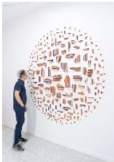
Composición en línea #5, 2023 220 cm de diámetro

En "Materia Sincera" , aborda la materialidad constructiva de la ciudad como problema estético y conceptual en la urbe contemporánea, una tradición heredada de la historia de la arquitectura y del urbanismo moderno que el artista observa desde el momento actual. La idea del blanco como búsqueda de la pureza tanto física como espiritual se contrasta con el rojo de la terracota. Tomando el ladrillo de arcilla como material pobre y sincero se desarrolla un cuerpo de trabajo que establece relaciones con el arte, la ciudad y la memoria . Con esto de fondo, los muros blancos de la galería se convierten en parte de la historia que pretende mostrar lo que ocultan dichos muros. El ladrillo se convierte en el hilo conductor donde los problemas e inquietudes del arte y la arquitectura se encuentran: el ornato, la decoración, el vacío, lo racional y lo barroco entran en un constante diálogo y tensión.