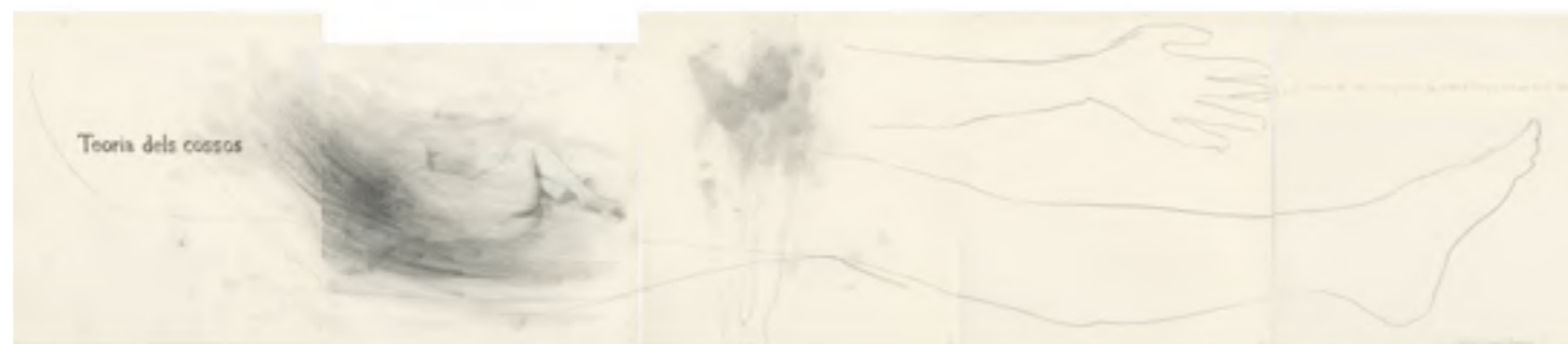
FUNDACIÓ VILA CASAS RocioSantaCruz Oriol Vilapuig: Teoria dels cossos II , 2017 Lapis i tinta sobre paper 30 × 148,5 cm