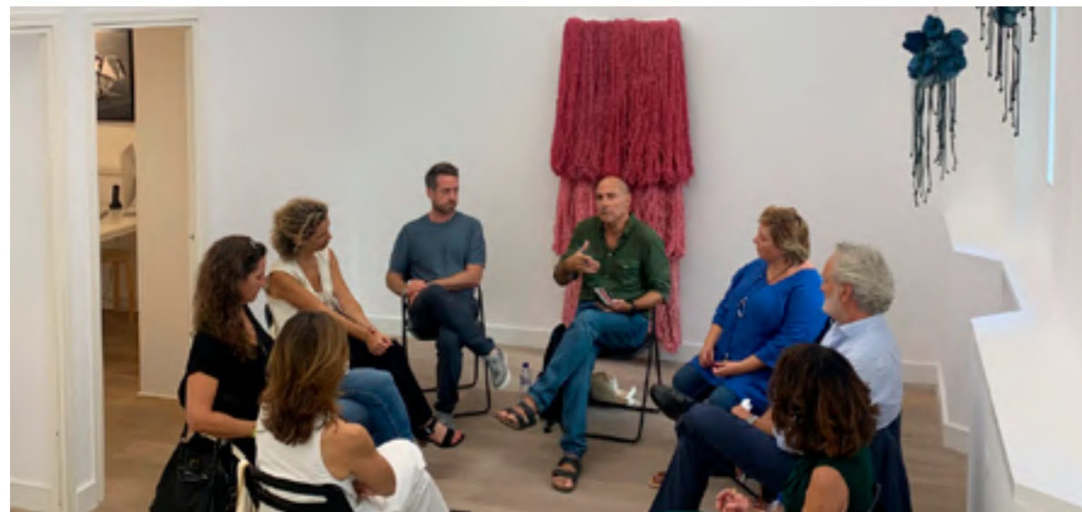
Private is the new public...? en la galería Zielinsky.