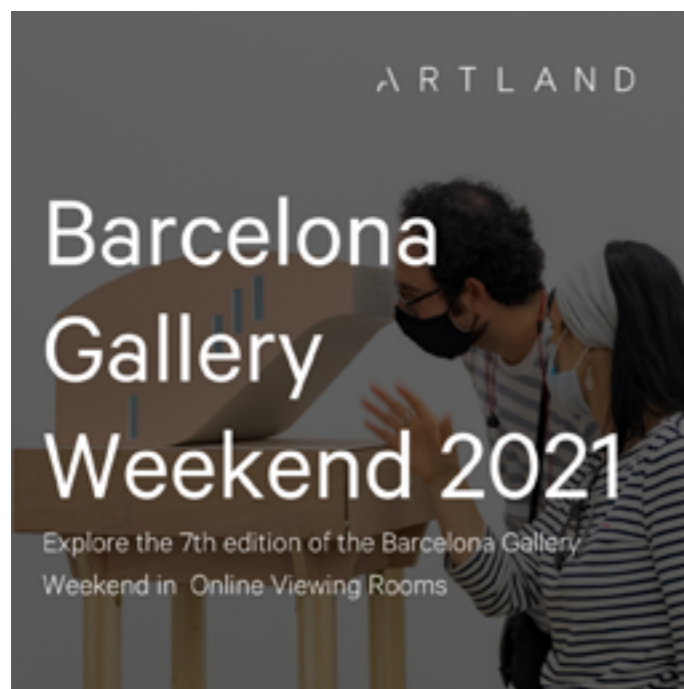
BGW x Artland Viewing rooms AQUÍ