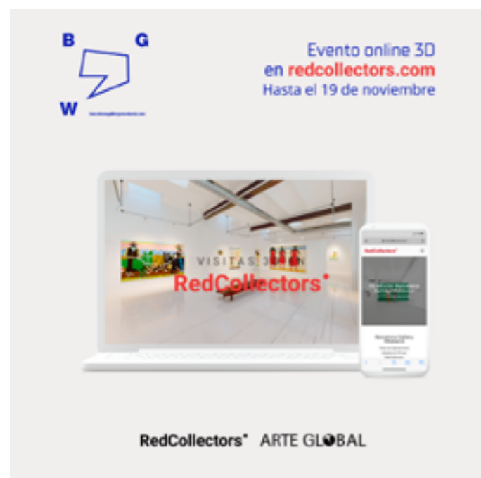
#BGWbyRedCollectors Exposiciones en las galerías participantes en 3D y asesoría online personalizada para la compra de obras AQUÍ .