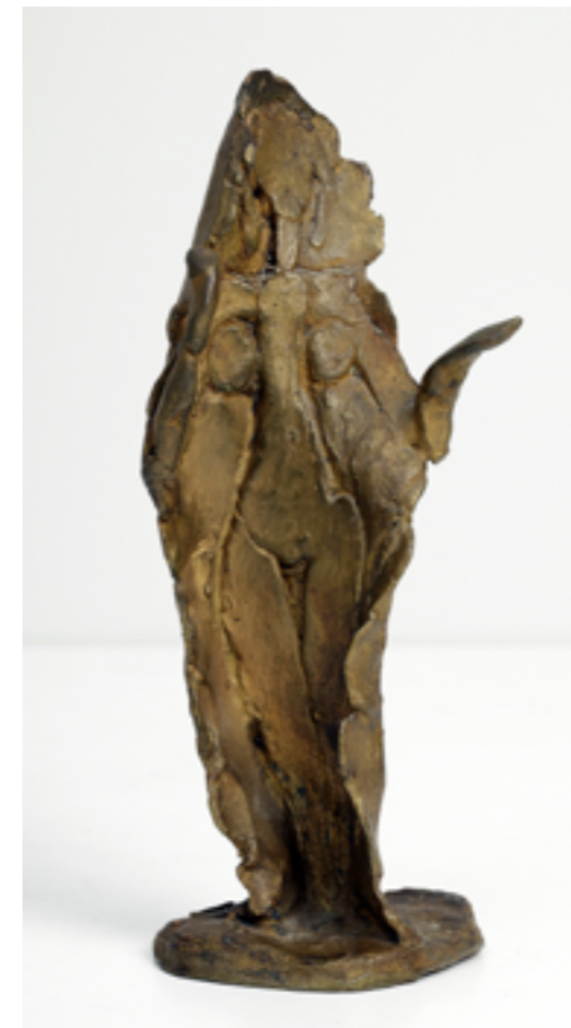
Apel-les Fenosa: Estampage, 1959 . Cortesía de Galeria Marc Domènech